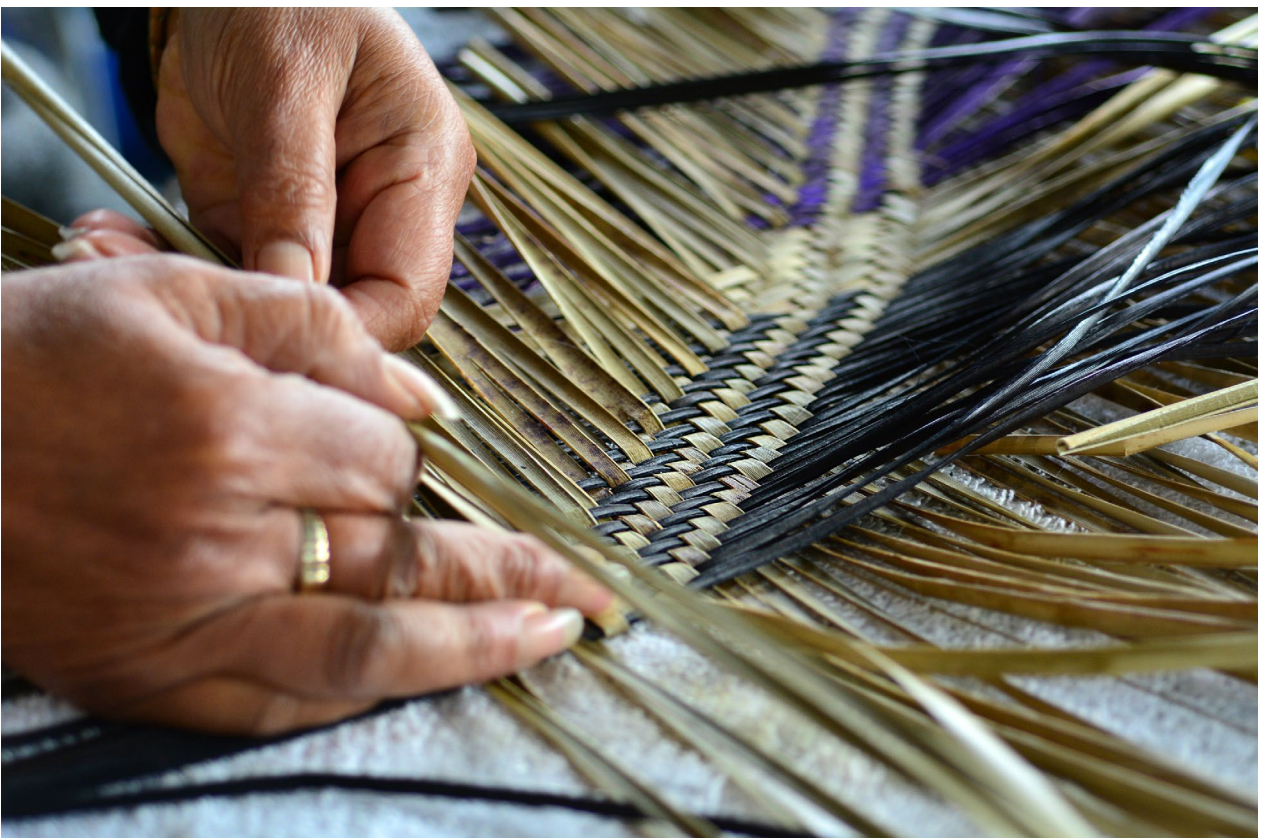
Māori Woven Artwork.

Mēnā kei te hiahia āwhina ki te tuku atu i ngā tāpaenga Kete Manarua, tēnā, kōrero ki tō Kaiako, ā, māna koe e awahi, e tautoko.